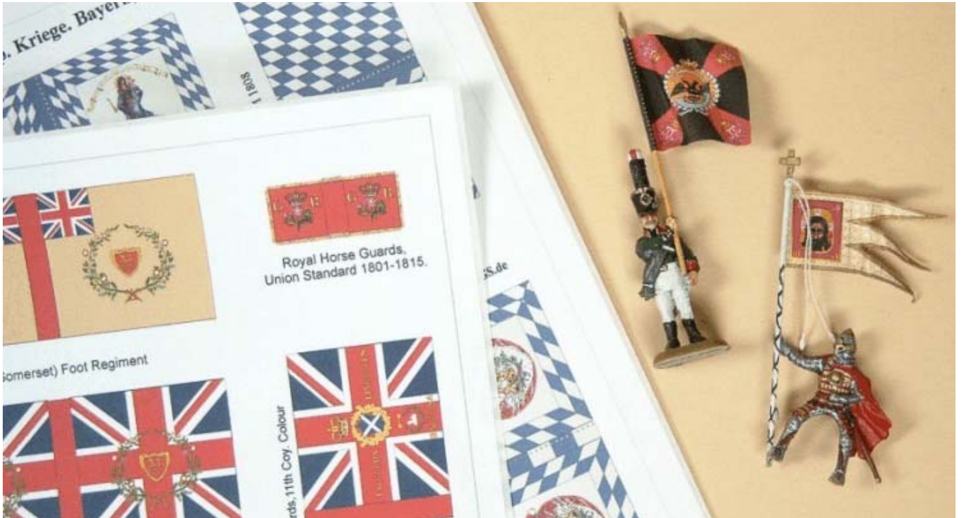
Zur Herstellung von Fahnenstangen 1/72: ROFUR-FLAGS Kunststoff-Pins.

Plastik-Pins für 1/72 Fahnenstangen und Speere, L=ca. 4,5 cm / Durchmesser 1mm., Farbe rot oder grün je nach momentaner Verfügbarkeit.