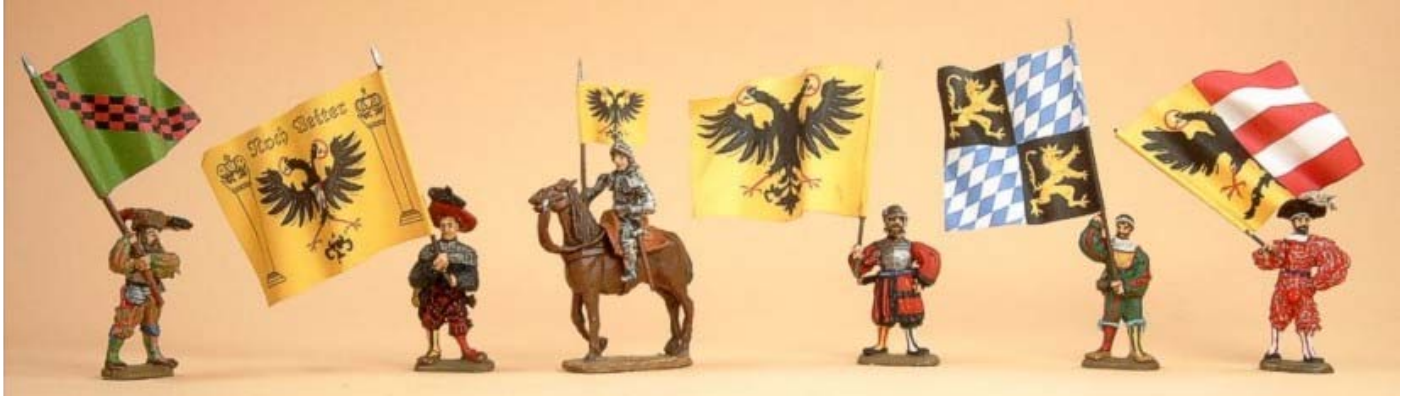
Schweizer Kantone, Burgunderkriege, Deutsche Landsknechte, Habsburgerreich, Bauernkriege, Hussitenkriege Die Tafelserie wurde in Zusammenarbeit mit Thomas Willers gestaltet.