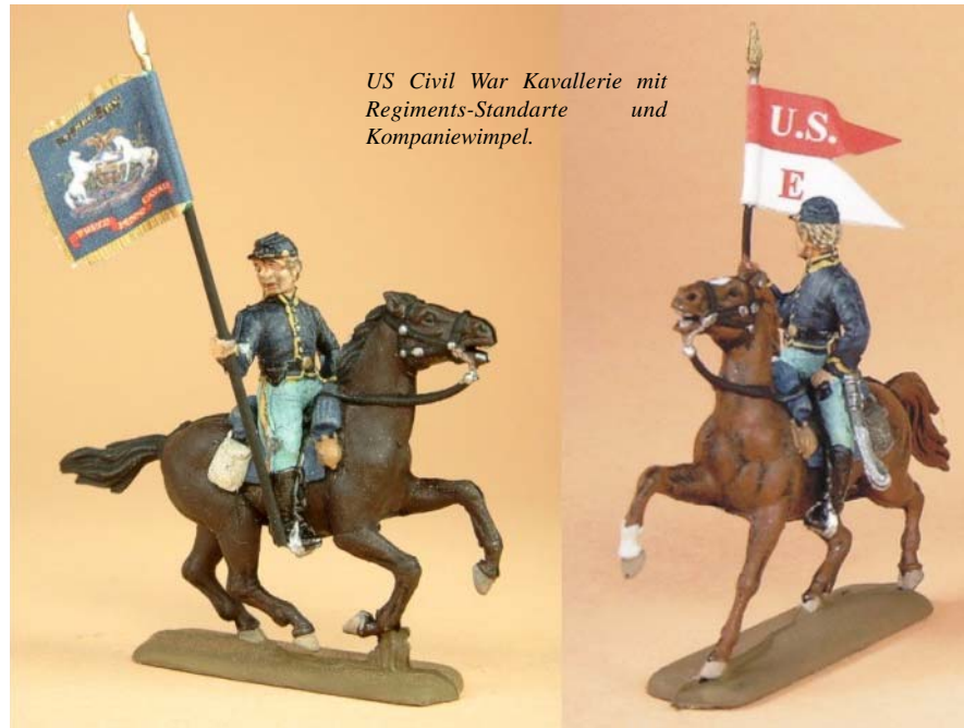
US Civil War Kavallerie mit Regiments-Standarte und Kompaniewimpel.